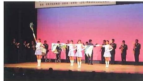
音楽隊・カラーガード隊の演奏・演技