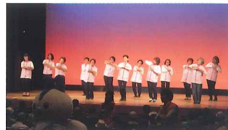
「イカのおすしのダンス等を通じた子ども見守り活動」の発表