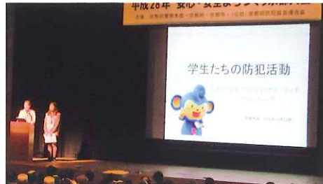
学生防犯ボランティアの活動報告