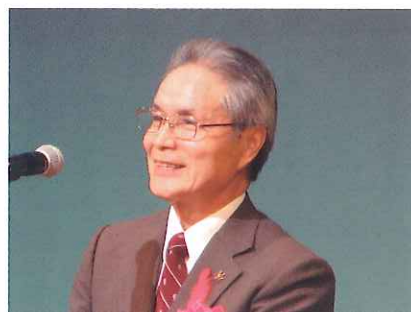
京都府単位防犯推進委員協議会会長祝辞

平成28年「全国地域安全運動」は、10月11日(火)から20日(休)までの間、全国一斉に展開しました。京都府下におきましては、運動重点を