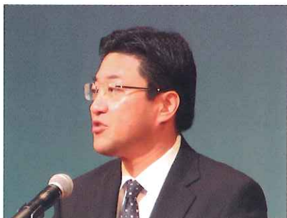
京都府警察本部長あいさつ