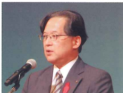
京都市副市長あいさつ