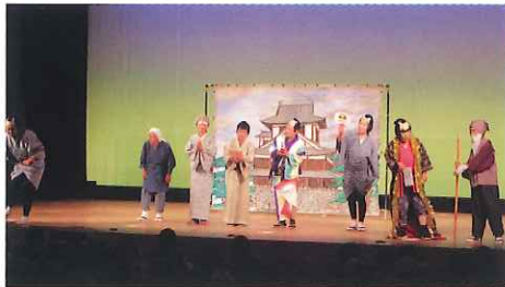
「防犯寸劇を通じた特殊詐欺防止啓発活動」の発表