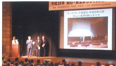
「JR二条駅周辺での防犯啓発活動」の発表