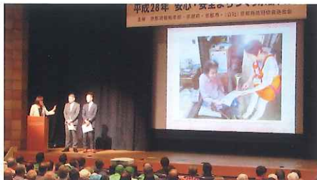
「宅配業務を通じた特殊詐欺防止啓発活動」の発表