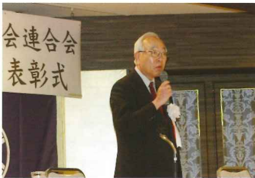
太田会長あいさつ