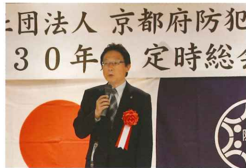
緒方警察本部長あいさつ